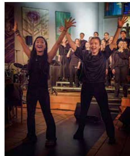
Bilde over: Glade toner fra oppstandelsen 1. påskedag.

Bilde til venstre: Et lydhørt publikum følger med. Bilde til høyre: Informasjon om Normisjon sitt barnearbeid i Aserbajdsjan som koret samlet inn penger til.