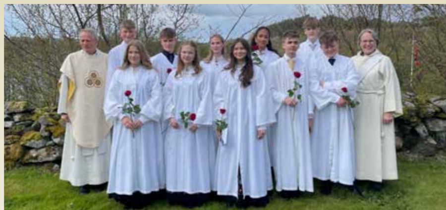
Illustrasjonsfoto: Ei av årets konfirmantgrupper i Tysvær kyrkje.

Konfirmantopplæringa er for alle som ynskjer det. Difor vil vi legge opp til tilpassa opplegg for dei som treng det. Ta kontakt om det er aktuelt! Vi legg til rette for dåp for ungdommar som ikkje er døypte.