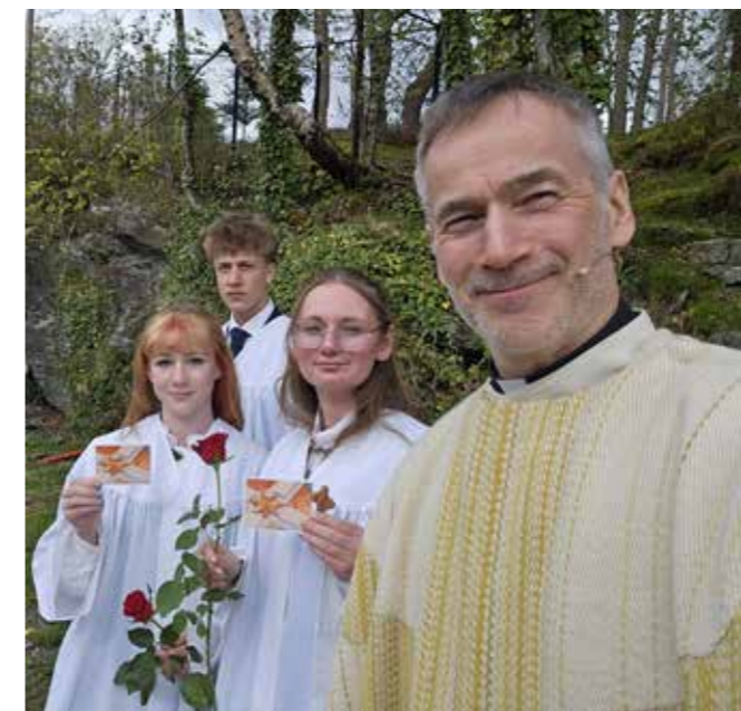
Bilete over: Konfirmantane «det minste kullet ever» i Nedstrand 10.mai.

Me høyrer kyrkjeklokkene ringer og musikken startar. Konfirmantane kjem inn med mjuke, fine kinn, i store, kvite kapper. For 15 år sidan kom dei også kvitkledde til kyrkja. Boren på armen av mor eller far eller ein stolt fadder. Kor blei tida av? No har dei med seg 15 års livsvisdom i kroppen og er på full fart inn i vaksenlivet. Dette året har dei fått gå ei trusvandring.