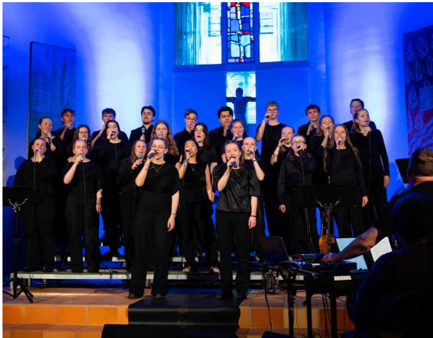
Norheimsund og Øystese ungdomskor under konserten på palmesøndag.