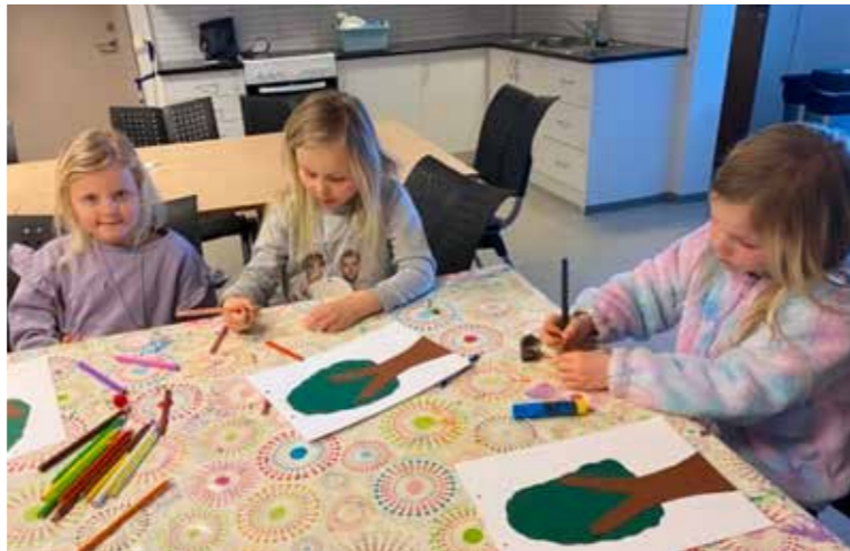
Bilde til venstre: Barnekoret Gledesprederen i Tysværvåg på vårtur. Bilde til høgre: Dåpsskulen på Førland i starten av mars.